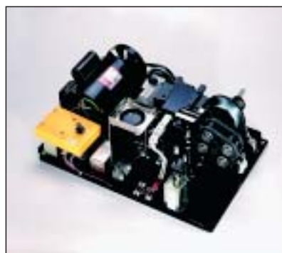
STRAPPER 1 L flejador especial de sobremesa